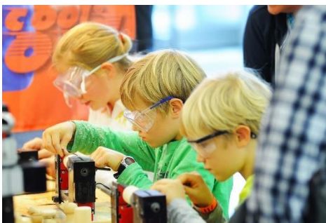
Sägen, bohren, schleifen, dreheln - hochkonzentriert im FORSCHA-Workshop

München, 26.09.2019: Drei Tage im Zeichen der Faszination von MINT und mehr: Die Mitmachmesse FORSCHA macht neugierig, ermutigt, begeistert und zeigt gemeinsam mit der SPIELWIESN , wie selbstverständlich spielerisches Lernen und lernen beim Spiel funktioniert. Das einzigartige Zusammenspiel aus Bildung und Unterhaltung auf